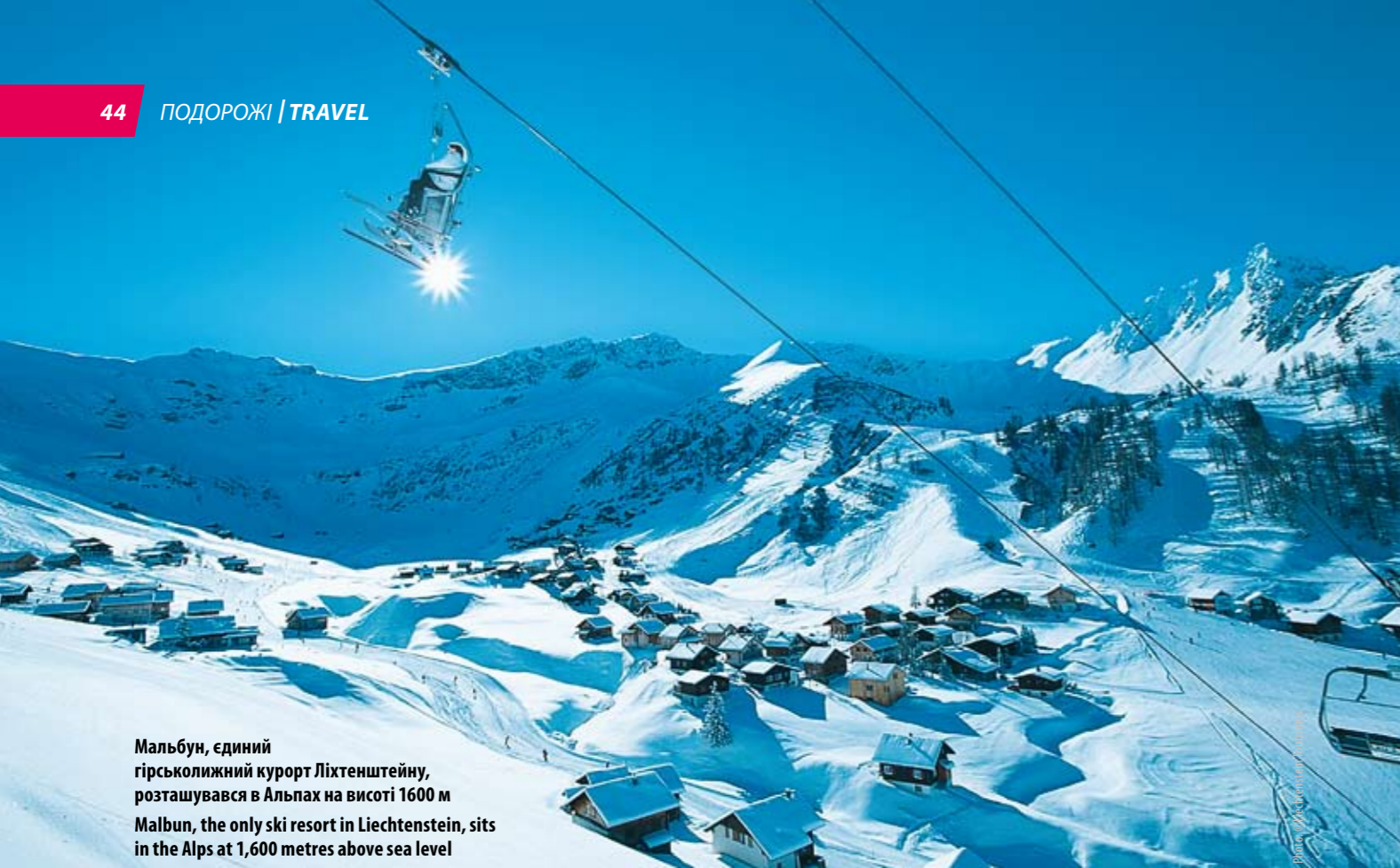
Мальбун, єдиний гірськолижний курорт Ліхтенштейну, розташований в Альпах на висоті 1600 м Malbun, the only ski resort in Liechtenstein, sits in the Alps at 1,600 metres above sea level

Від Швейцарії Ліхтенштейн відокремлює лише малесенький міст. Країни давно підписали двосторонній митний союз, а тому жодного контролю на невидимому кордоні немає. Князівство радіє своєму транзитному положенню між Австрією та Швейцарією, адже цікаві туристи зупиняться тут хоча б на кілька годин. А потім повертаються знову, щоби ближче познайомитися з маловідомим краєм, де мешкають справжні князі.