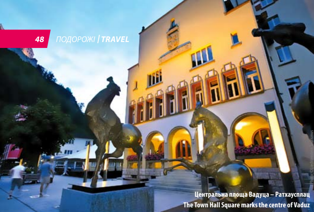
Центральна площа Вадуца – Ратхаусплац The Town Hall Square marks the centre of Vaduz

⚡ Вхід безкоштовний, а враження безцінні. А ще у Вадуці є Музей калькуляторів та друкарських машинок: як і годиться крихітній країні, один з експонатів на ймення Curta — то найменший механічний калькулятор у світі! До речі, марки з Ліхтенштейну — сувенір, що за оригінальністю не поступається печатці у паспорти, яку мені поставили в туристичному офісі. Там же продаються марки яких завгодно різновидів. Ціни — від 3 швейцарських франків (2 євро) до 100 євро. Стою, захоплено розглядаю марки, і тут продавець несподівано питає: “Ви з України?”. “Так”, — відповідаю здивовано. “Тоді вам просто необхідно поговорити з одним українцем, який вже давно мешкає в Ліхтенштейні”. Не давши прийти до тями, набирає номер і додає: “Говоріть ввічливо — це сам барон!” Голос по той бік слухавки мовив: “Українка? Чому ще не в мене в гостях? Чекаю через півгодини”. Уже потім з’ясувалось, що спілкувався зі мною Едуард фон Фальц-Фейн, виходець з України.