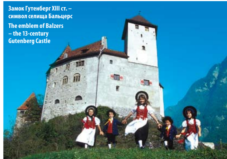
Замок Гутенберг XIII ст. – символ селища Бальцерс The emblem of Balzers – the 13-century Gutenberg Castle

Today, the country has become a first-class destination for banking and business, as well as for travel, attracting skiers in the winter and hikers to its slice of the Alps in summer. Locals, with good reason, like to say it is a “small country with great views”. Liechtenstein's snow-capped mountain peaks reach 2,600 metres and transform into pristine alpine meadows at lower altitudes.